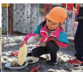
白ご飯を入れ ますね！