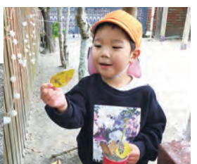
かわいくデコ レーション♪