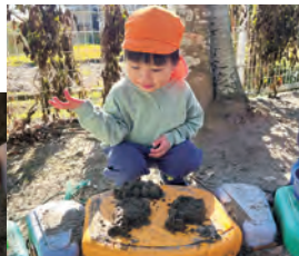
せーの 出来上がり！

一方で、『砂場遊び』には、指先の発達を促す効果や、友だちとの関わりの中で遊びが広がる楽しさがあります。また、崩れやすい砂を使うことで忍耐力が養われ、創造的な表現力を育むこともできます。今回は、この二つの遊びを融合させた活動を通して、子どもたちの豊かな発想力が光る作品ができましたので紹介します。