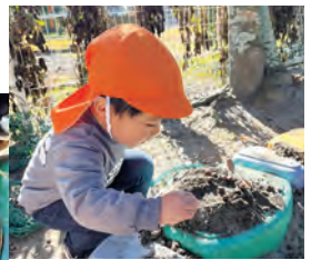
クリームを乗 せて♪