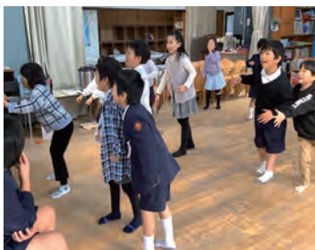
だるまさんがころんだ