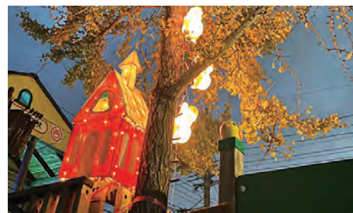
(以上、保育向上グループ)