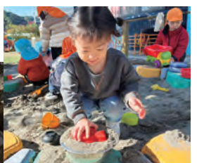
お魚も乗せる よ。ハイ！