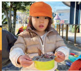
葉っぱを沢山 乗せたよ！