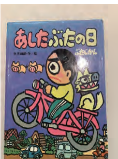
あしたぶたの日 ぶたじかん