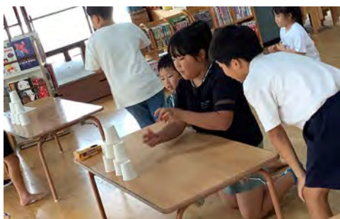
紙コップ的当てゲーム