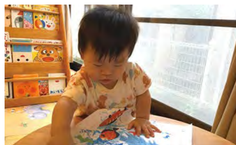
たなか あお 田中 碧 さん