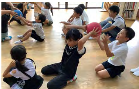
ボール送りゲーム