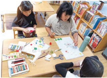
エコクラブ活動 製作