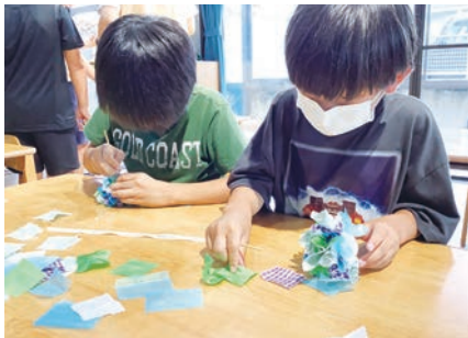
ふれあい活動 製作